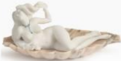
Moda e Bellezza